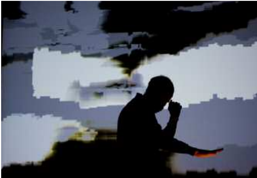
Labyrinth / Photo : Bernard Pulcini (2013)